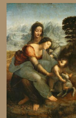
Léonard DE VINCI

" FAITES TOUJOURS QUE VOTRE TABLEAU SOIT UNE OUVERTURE AU MONDE " .